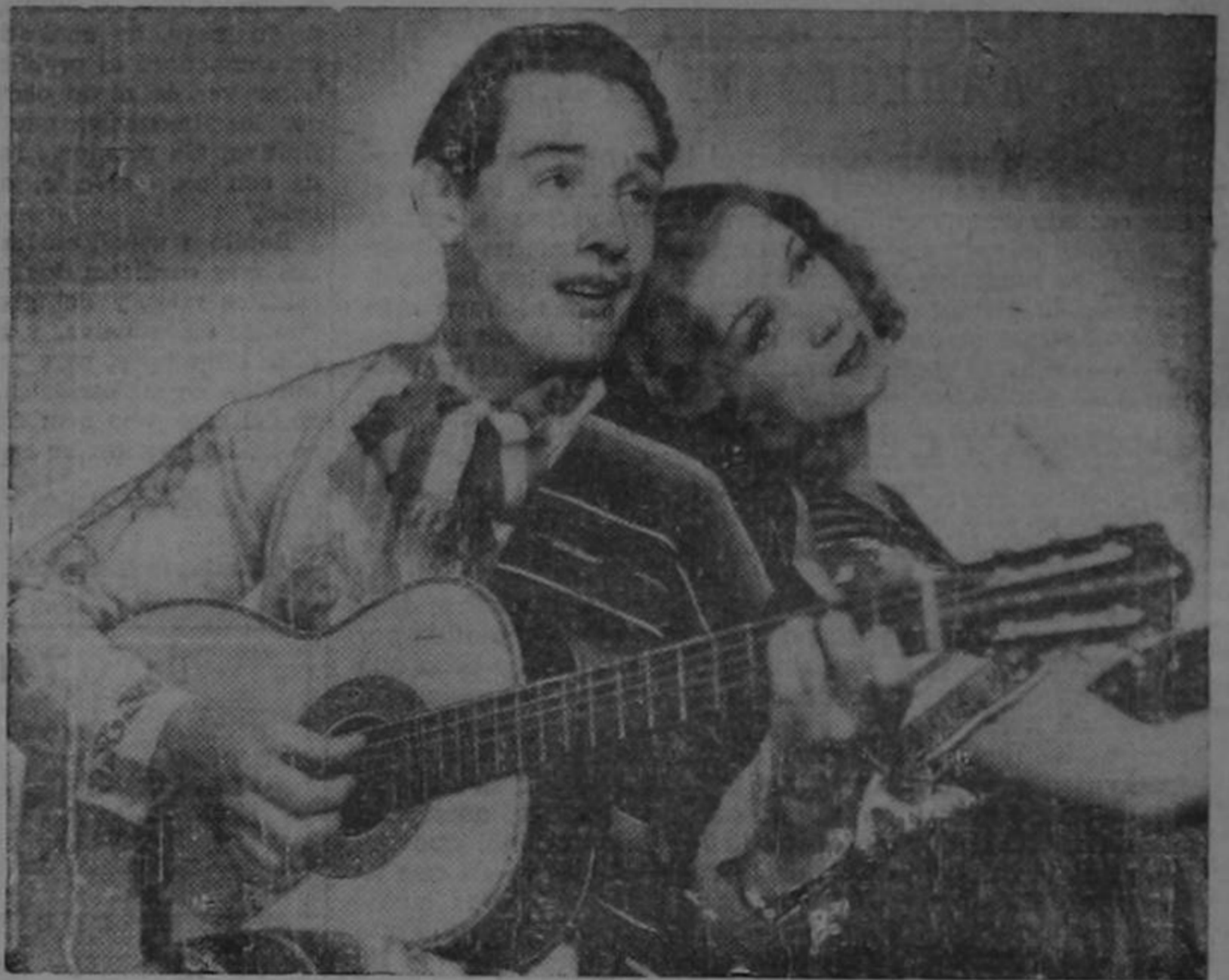
Producciones Cobián presenta a TITO GUIZAR en "MIS DOS AMORES" con Blanca de Castañón

da, ha de tomar de uno y otro sus elementos. Pero convengamos en que, sin exageraciones moralistas, bien pudo, y puede moderarse el daño que causa "el cine en las cabecitas nuevas y en las personas sin discernimiento.